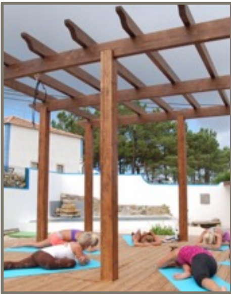
Yoga i UNION - tillsammans!

https://www.facebook.com/pages/Casa-Da-Adega/689459191123666?sk=photos_stream