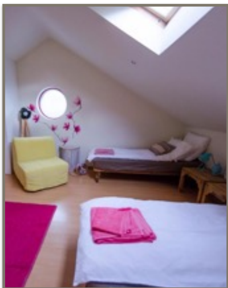
Ljuvliga, personliga rum

Solskydd Solhatt Sköna yoga kläder Dagbok och pennor Väckarklocka Kamera